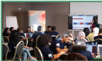
Formations en Softskills